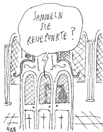
© Hauck & Bauer - „Ist das noch Entspannung oder schon Langeweile?“, Verlag Antje Kunstmann, 2018.